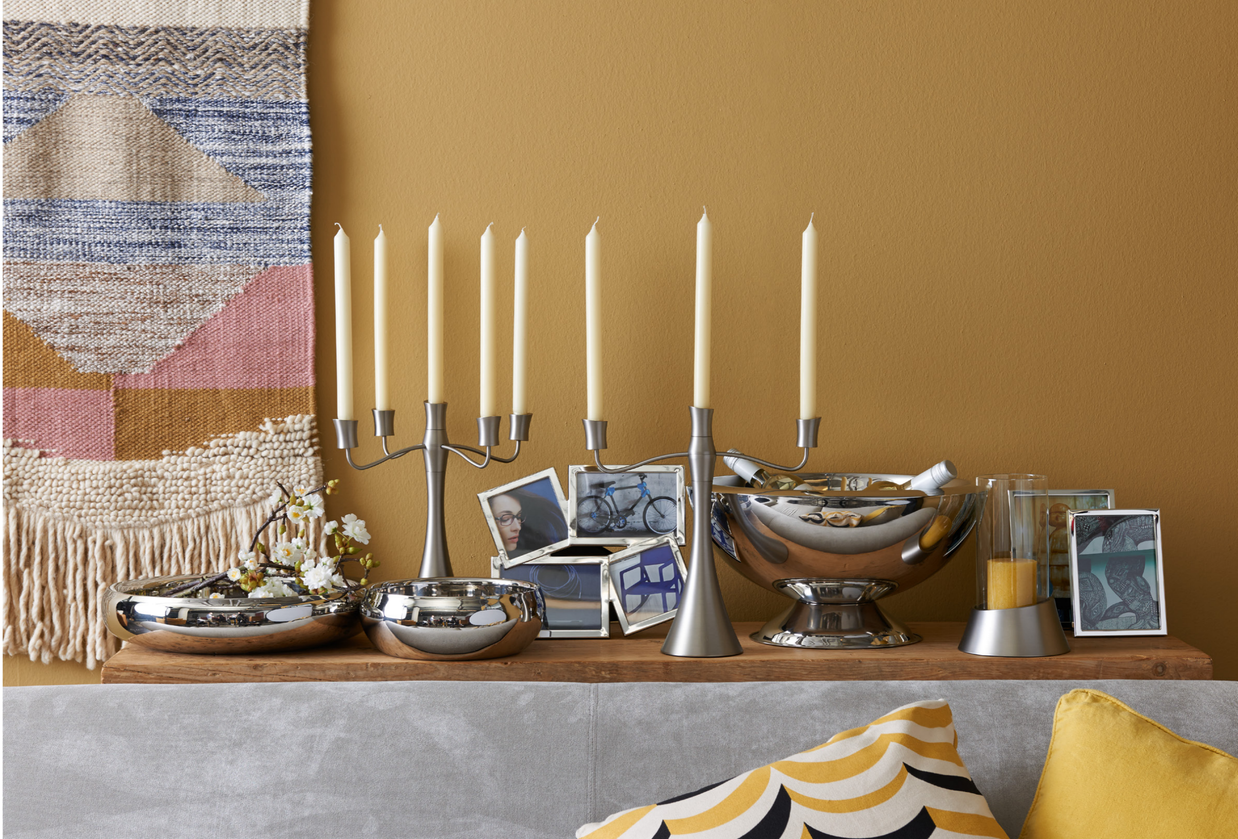
Schaal Deco dubbelwandig • Kandelaar Monte 5-pits • Schaal Largo dubbelwandig • Fotolijst Oregon • Kandelaar Monte 3-pits • Champagneschaal dubbelwandig • Windlicht Monte • Fotolijst Madeira